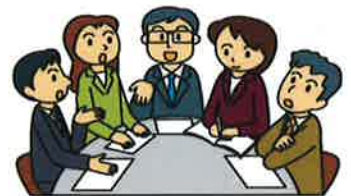
消費者庁 イラスト集より

千葉県初の適格消費者団体を目指すNPO法人消費者市民サポートちばの設立を記念し、適格消費者団体による差止請求や新法による損害賠償請求の必要性を共有して、県内における適格消費者団体の設立に向けた第一歩とするシンポジウムです。ぜひご参加下さい。