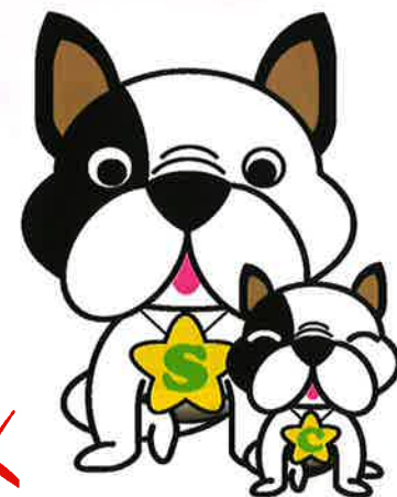
サポっち & ちぼっち