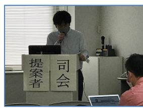
町田監事による監査結果報告