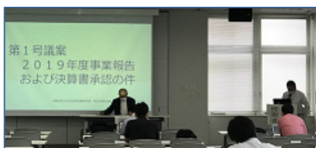
選出された小柳議長