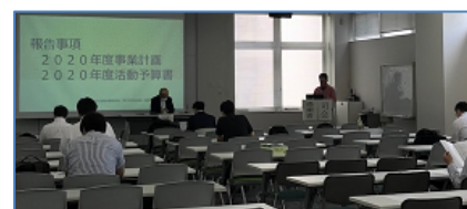
常岡副理事長による2020年活動及び活動予算書の説明